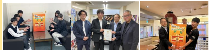
【蛇口ジュース機材製作者の皆さん】