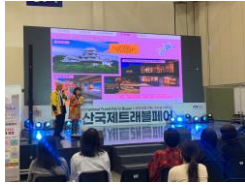
《トラベルフェアの様子》