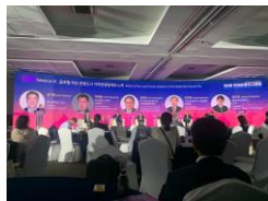
《フォーラムの様子》

直行便の就航で、釜山での愛媛・松山の認知度や関心は着実に高まっていると感じた一方、まだまだ市場開拓の余地は大きく、継続的なPRが重要であると確信しました。松山-釜山便は、9月16日（月）から週5便に増便、10月27日（日）からは週6便に増便予定です。皆さんも是非、松山空港を利用して韓国に気軽に旅行してみたいでしょうか。