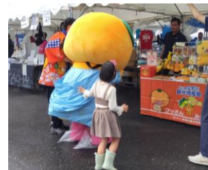
《当協会でも珍しいみきゃんだらけの売台》 《カッパを着て頑張るみきゃんの後姿》