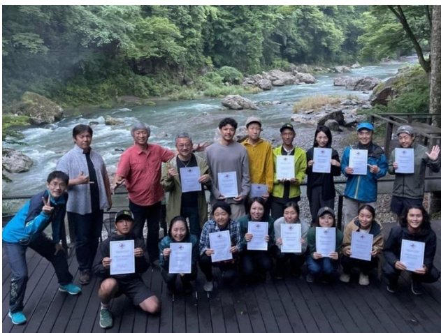
(過去の WFA 野外研修の様子)