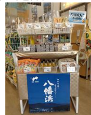
市町フェア特設コーナー