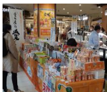
イオンモール茨木 (大阪府)

令和5年度は、コロナ対策も緩和されたことから、昨年度以上に県外での催事に注力し、県産品の販路維持・拡大を図っていきます。