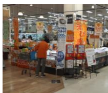
イオンモール熱田店 (愛知県)