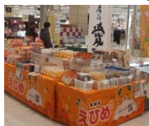
イオンモール福岡 (福岡県)